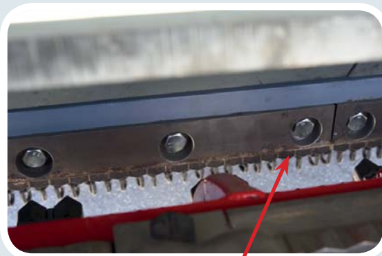
Primera etapa de trituración con piezas de carburo de tungsteno.