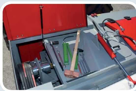
Kit de herramientas a bordo - incluye también una herramienta de extracción (no mostrada) que permite un reemplazo rápido y fácil de los martillos de trituración