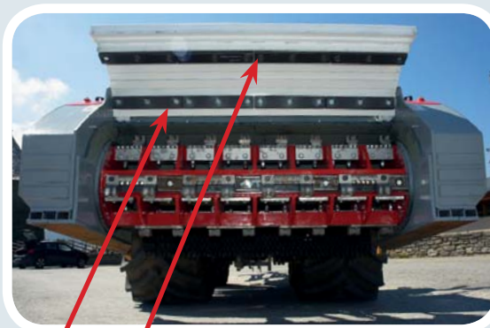
Segunda & tercera etapa de trituración en tapa protectora