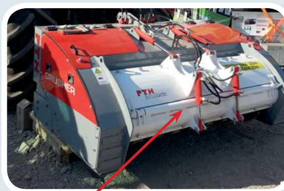
Puerta trasera dividida para ajuste hidráulico de la 3ª etapa de trituración. Esta opción es una posibilidad avanzada para el ajuste fino del material